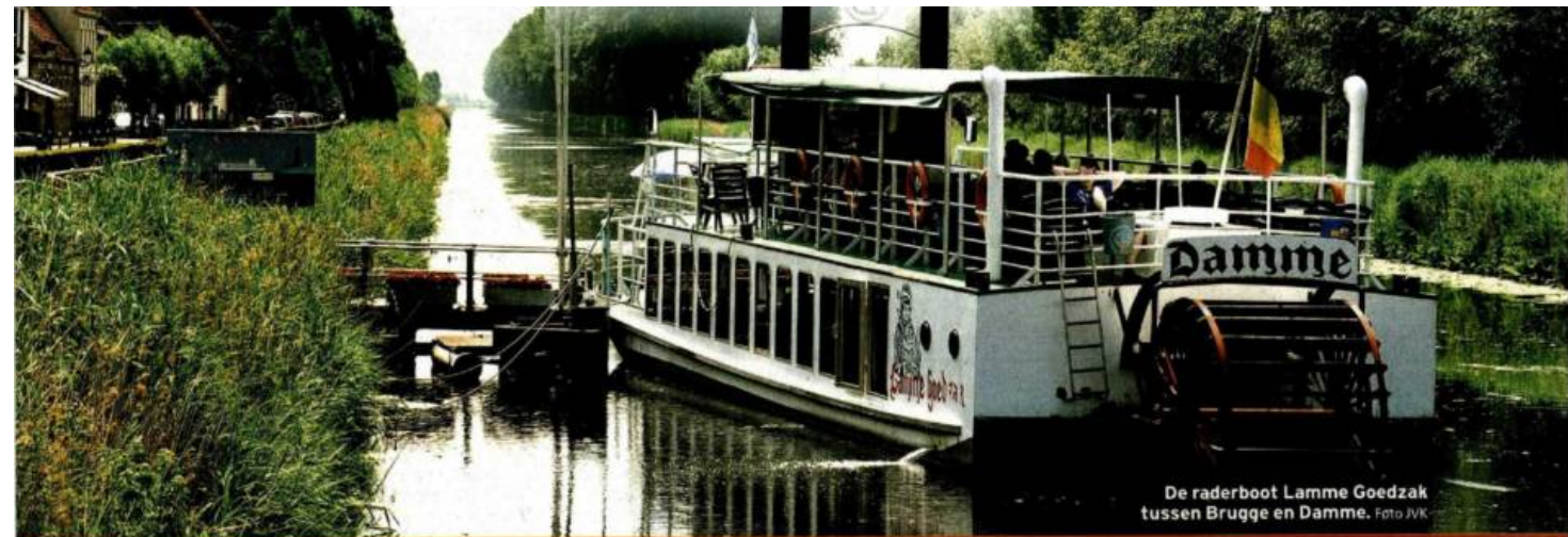
De raderboot Lamme Goedzak tussen Brugge en Damme.